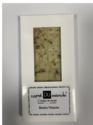
Tablette Bean to Bar Blanka Pistache