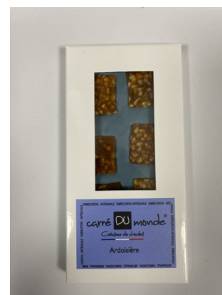
Tablette Bean to Bar Ardoisière