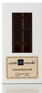
Tablette noir fourrée caramel beurre salé