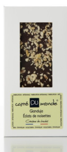
Tablette noir fourrée Gianduja, éclat de noisettes