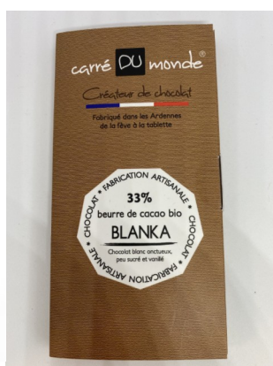
Tablette Bean to bar Blanka 33%