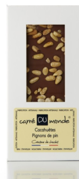
Tablette lait fourrée cacahuète, pignon de pin